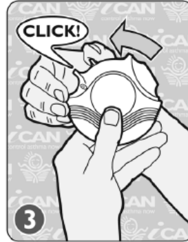
SLIDE & CLICK