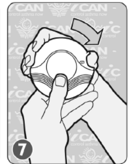
PUSH TO CLOSE