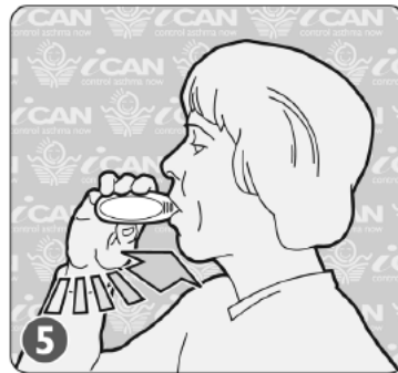
DEEP BREATH IN & HOLD