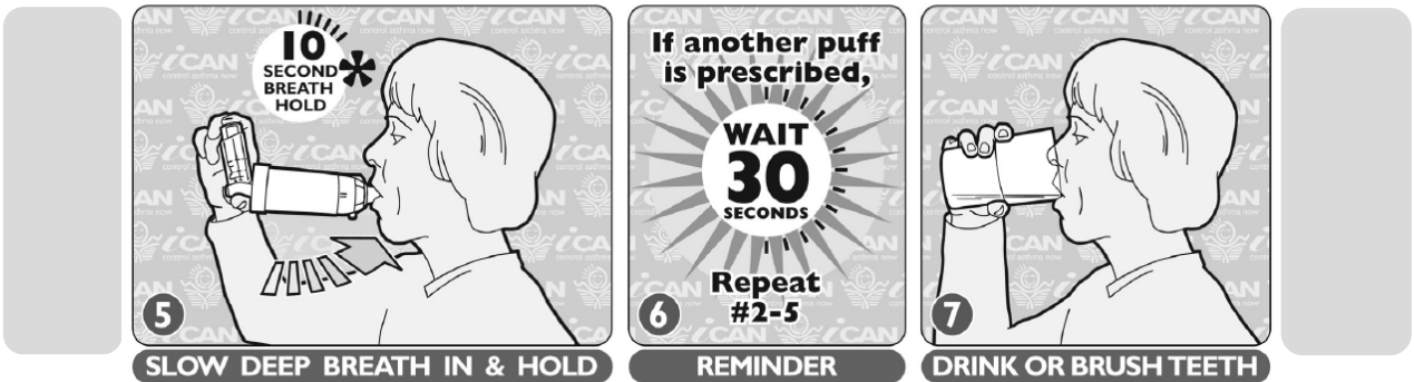
5. ਅੰਦਰ ਡੂੰਘਾ ਸਾਹ ਲਵੋ ਅਤੇ ਰੋਕ ਕੇ ਰੱਖੋ 6. ਯਾਦ ਦਹਾਨੀ 7. ਪਾਣੀ ਪੀਓ ਜਾਂ ਦੰਦਾਂ 'ਤੇ ਬੁਰਸ਼ ਕਰੋ