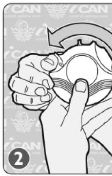
2. ብድፍኢት ክፈት