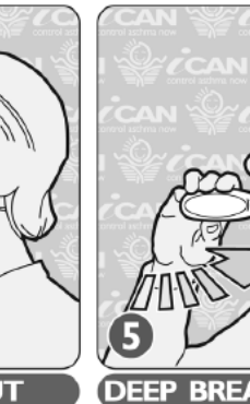
5. ዓሚቕ ትንፋስ ንውሽጢ ስሒብካ ሓዞ